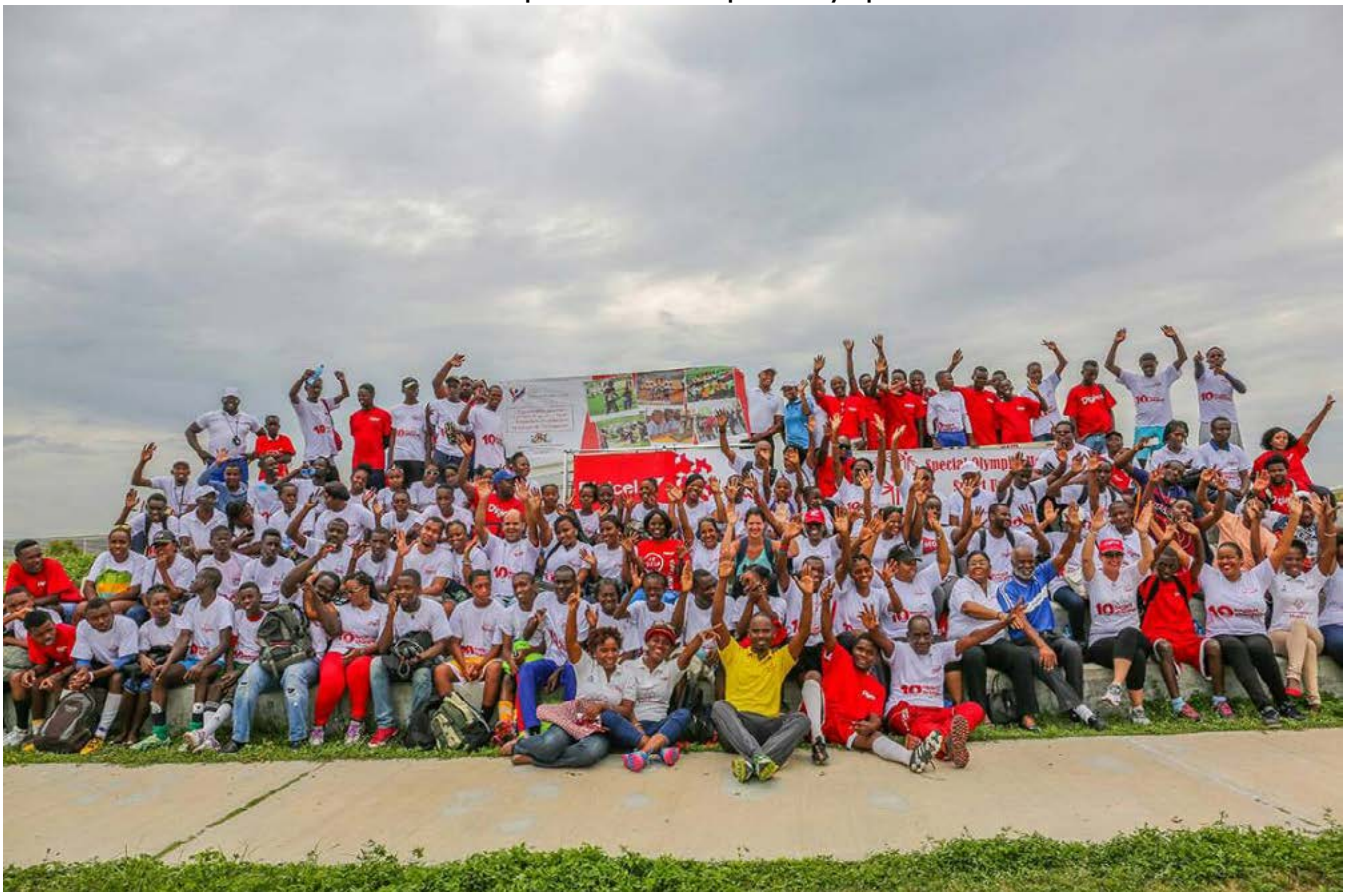
Cloture de la journée de sport unifié au Centre Sportif pour l'Espoir à Cité Soleil