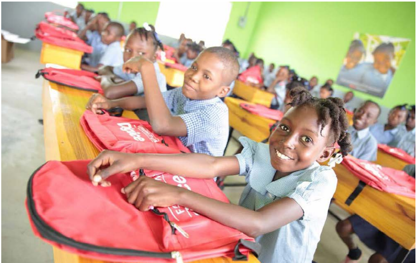
Ecole Nationale PJ Mara de Jolivert à Bassin Bleu