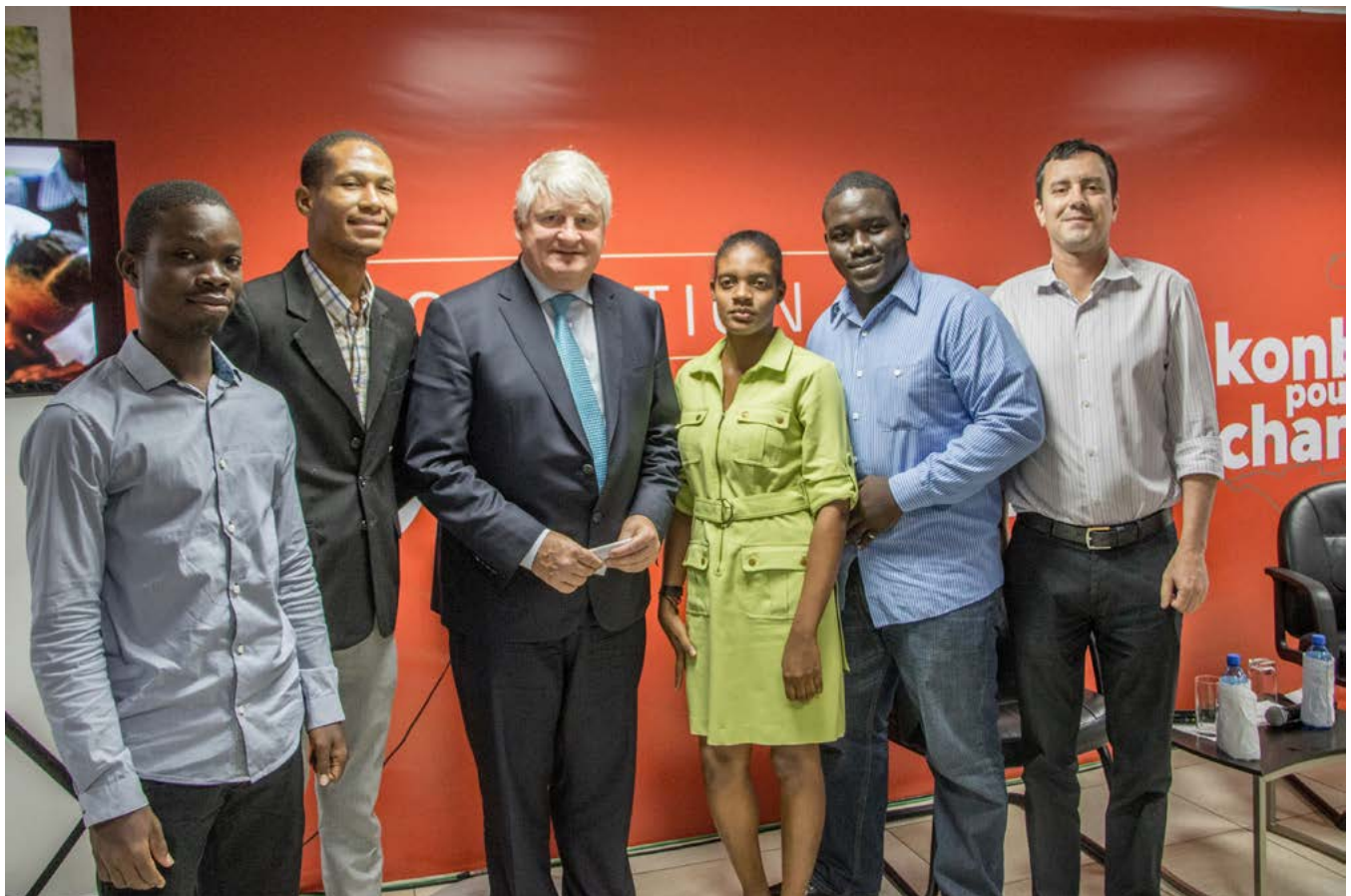
Activité organisée à l'intention des boursiers de HELP