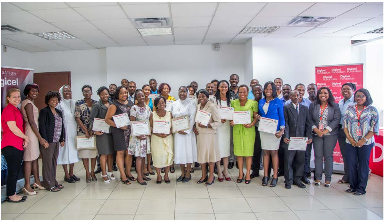
Les 20 meilleurs enseignants ayant reçus des primes d'excellences