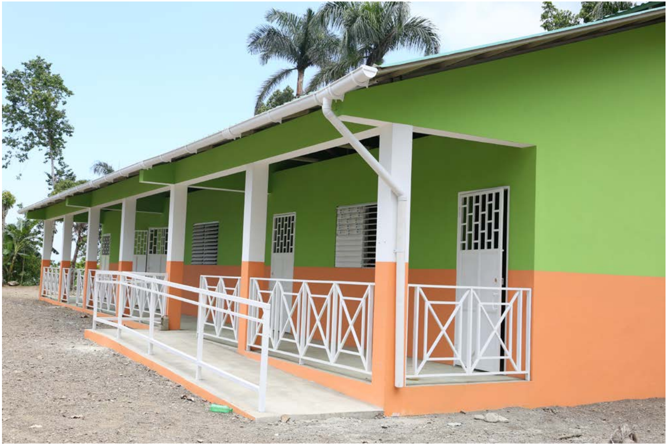
Ecole Notre Dame du Perpétuel Secours à Durissy