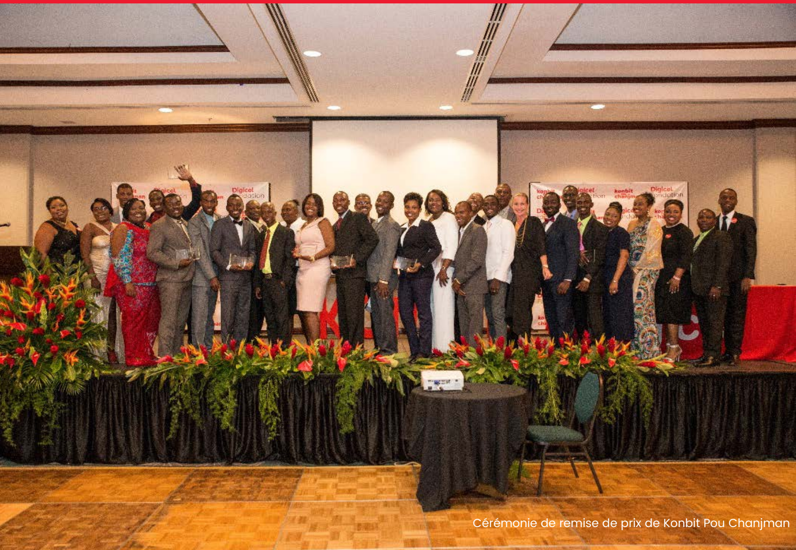
Cérémonie de remise de prix de Konbit Pou Chanjman