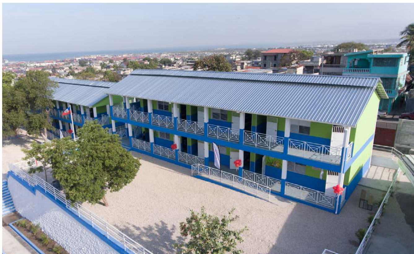
Ecole Congréganiste Nationale Notre Dame du Perpétuel Secours au Bel Air