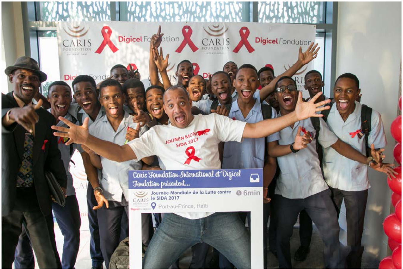
Activité de volontariat à l'occasion de la Journée Mondiale du Sida