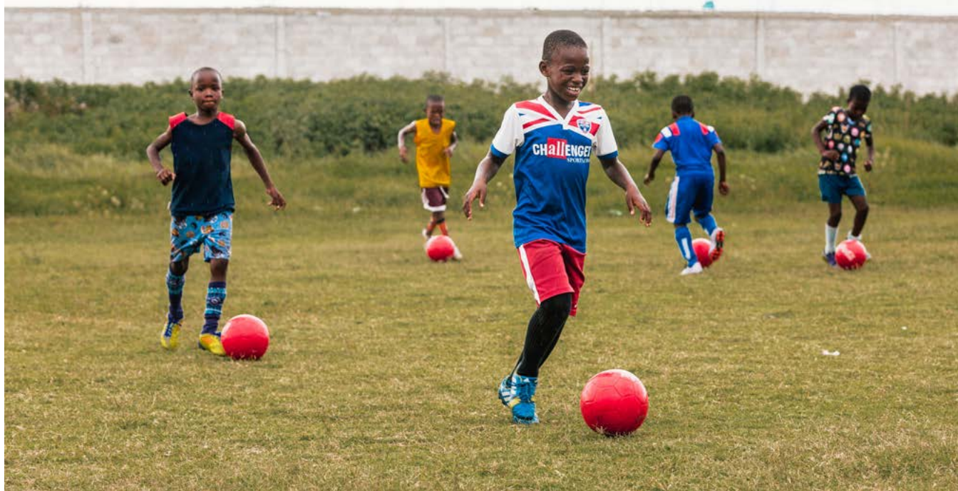
Fondation l'Athlétique d'Haïti