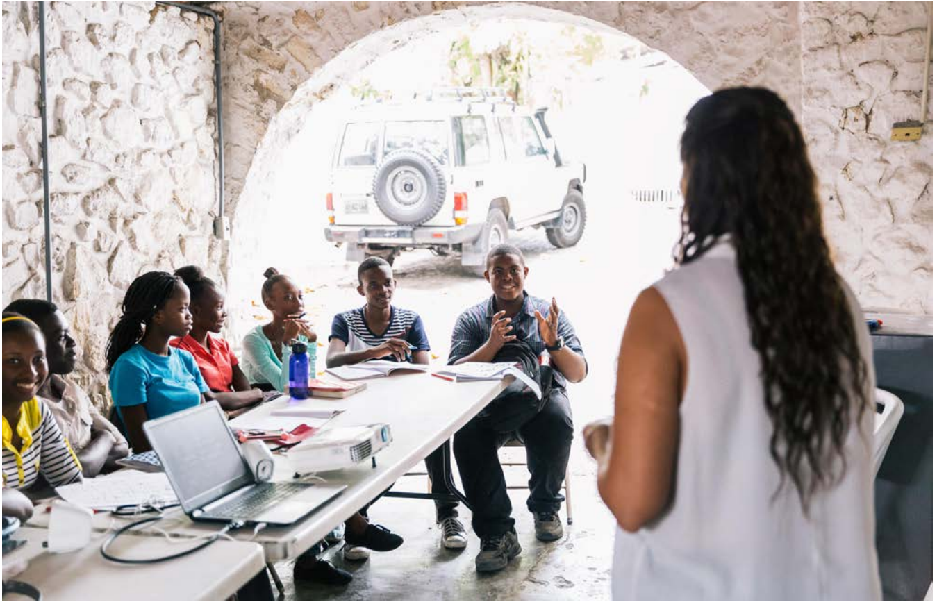
Haitian Education and Leadership Program