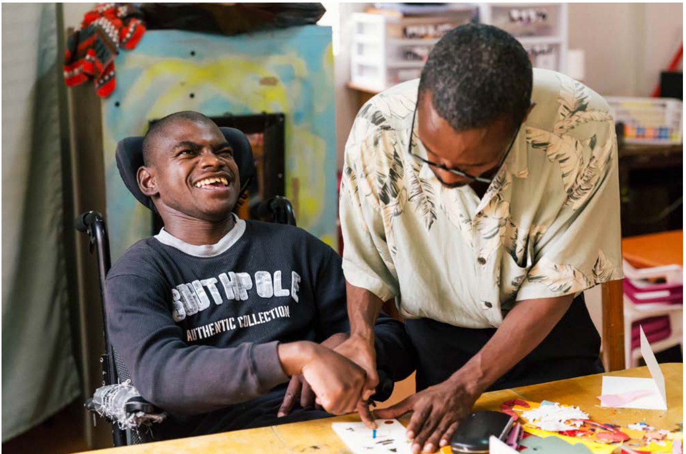
Nos Petits Frères et Soeurs