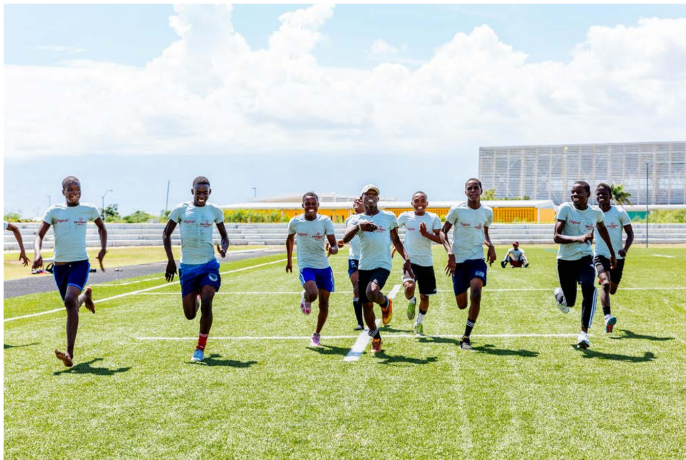
Special Olympics Haïti