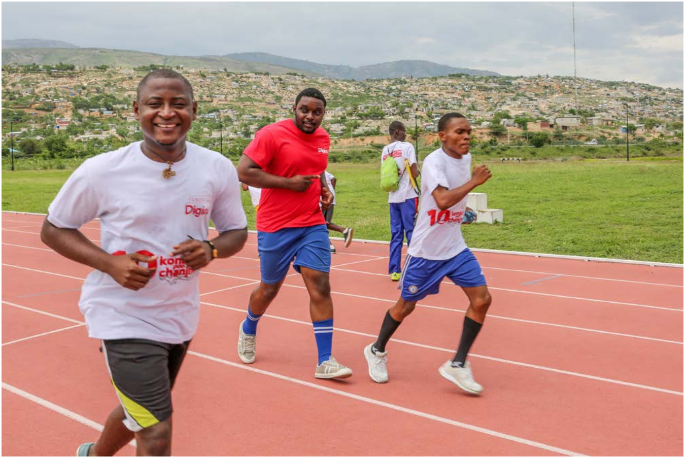
Journée de sport unifié avec Special Olympics Haiti