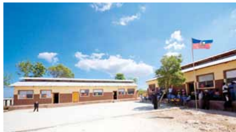
■ Une vue de l' Ecole Presbytérale de la Fraternité de Gros Mangles (La Gonâve)*