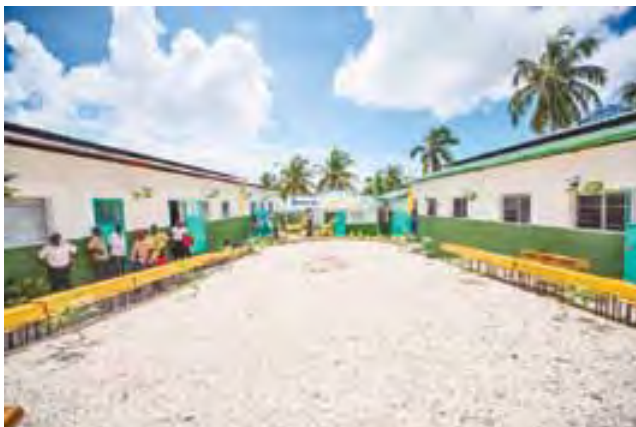
Une vue de l'École de la Coopérative des Planteurs de Vetiver de Debouchette

La grande aventure continue, elle nous conduit parfois dans des endroits très difficiles d'accès où faire parvenir les matériaux de construction relève d'un véritable exploit. Cependant, la Fondation Digicel ne recule pas face aux nombreux sacrifices à consentir afin d'améliorer la qualité de l'éducation offerte aux enfants haïtiens qui