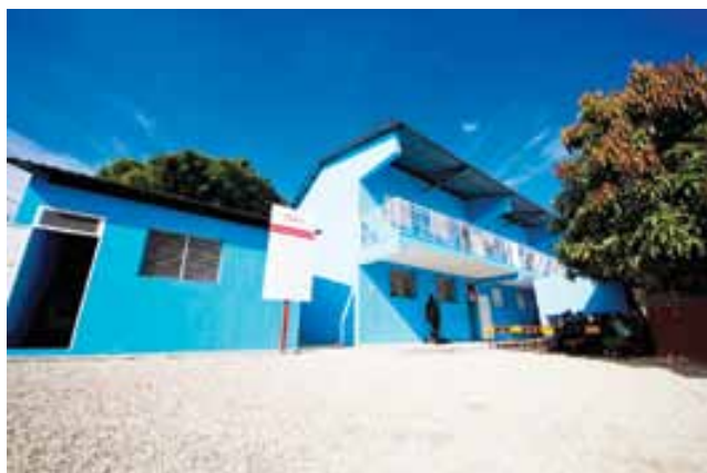
■ Ecole Etam Croix des Bouquets

par département. Les sites sélectionnés sont très intéressants et nous sommes déjà impatientes du changement que la Fondation Digicel apportera très bientôt dans la vie des centaines d'élèves qui fréquentent ces écoles nationales.