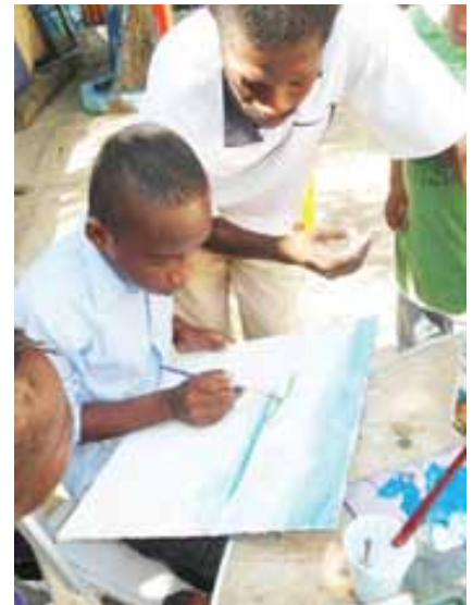
Regroupement des Patriotes Progressistes et Dynamiques Haïtiens

En partenariat avec la Fondation Digicel, RPPDHA a pu fournir 103 jours d'activités incluant la formation du personnel sur une variété de sujets tels : le sport, les arts et loisirs, sans oublier une exposition artisanale avec les dessins des enfants.