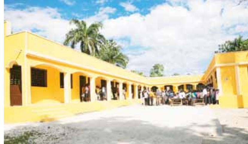
■ Vue de l'Ecole Foyer des Enfants de Desbayes (Plateau Central)", financée par W. K. Kellogg Foundation