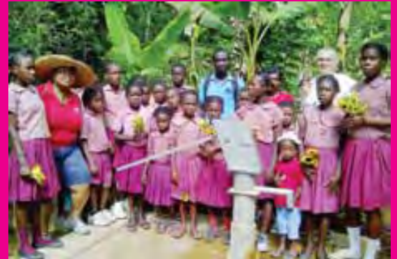
Quelques uns des bénéficiaires du projet Eau Potable aux Abricots