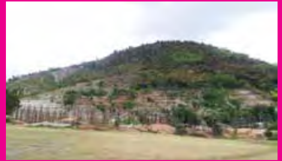
Vue de la zone du projet de CREFWA

La Fondation a également joué un rôle actif dans la lutte contre le choléra en finançant un projet de la Fondation Paradis des Indiens consistant en l'installation de 11 puits pour fournir l'eau potable à plus de 3,600 enfants des écoles de la commune des Abricots.