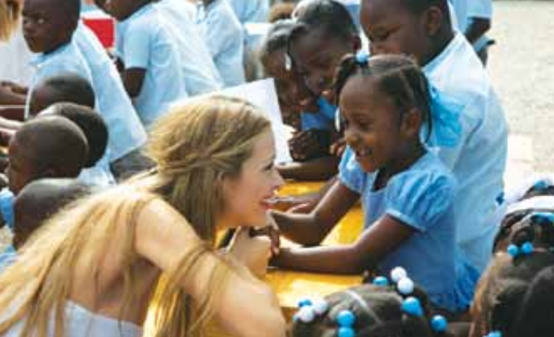
■ La Fondatrice de HHF, Petra Nemcova, avec des élèves à Foyer des Archanges.