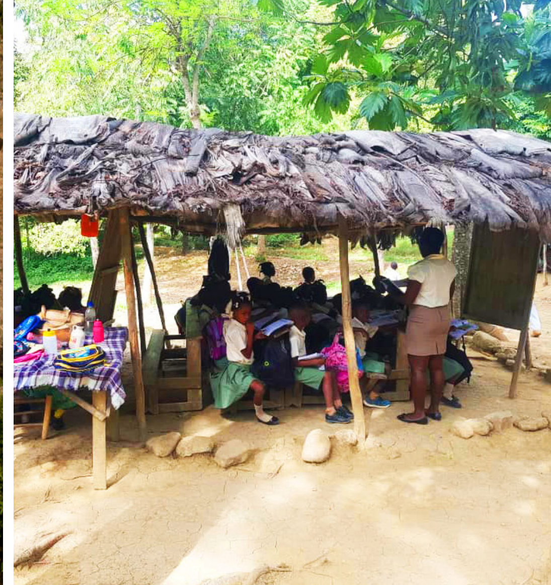
Photo d'avant de l'école

été gravement endommagée lors du tremblement de terre de 2010 en Haïti. Peu de temps après, pour répondre à l'urgence, la Fondation Digicel a fourni à l'école une structure modulaire pour permettre aux élèves de reprendre leurs études. Dix ans plus tard, et après une usure importante, la Fondation Digicel a retiré les conteneurs transformés en salles de classe et a construit un véritable bâtiment de deux étages avec six salles de classe, une administration, un bloc sanitaire et un réservoir de 5,000 gallons. Ce projet a été inauguré le 13 novembre 2021.