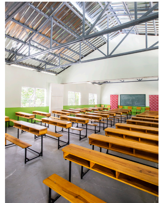
Sainte Claire de Saut d'Eau