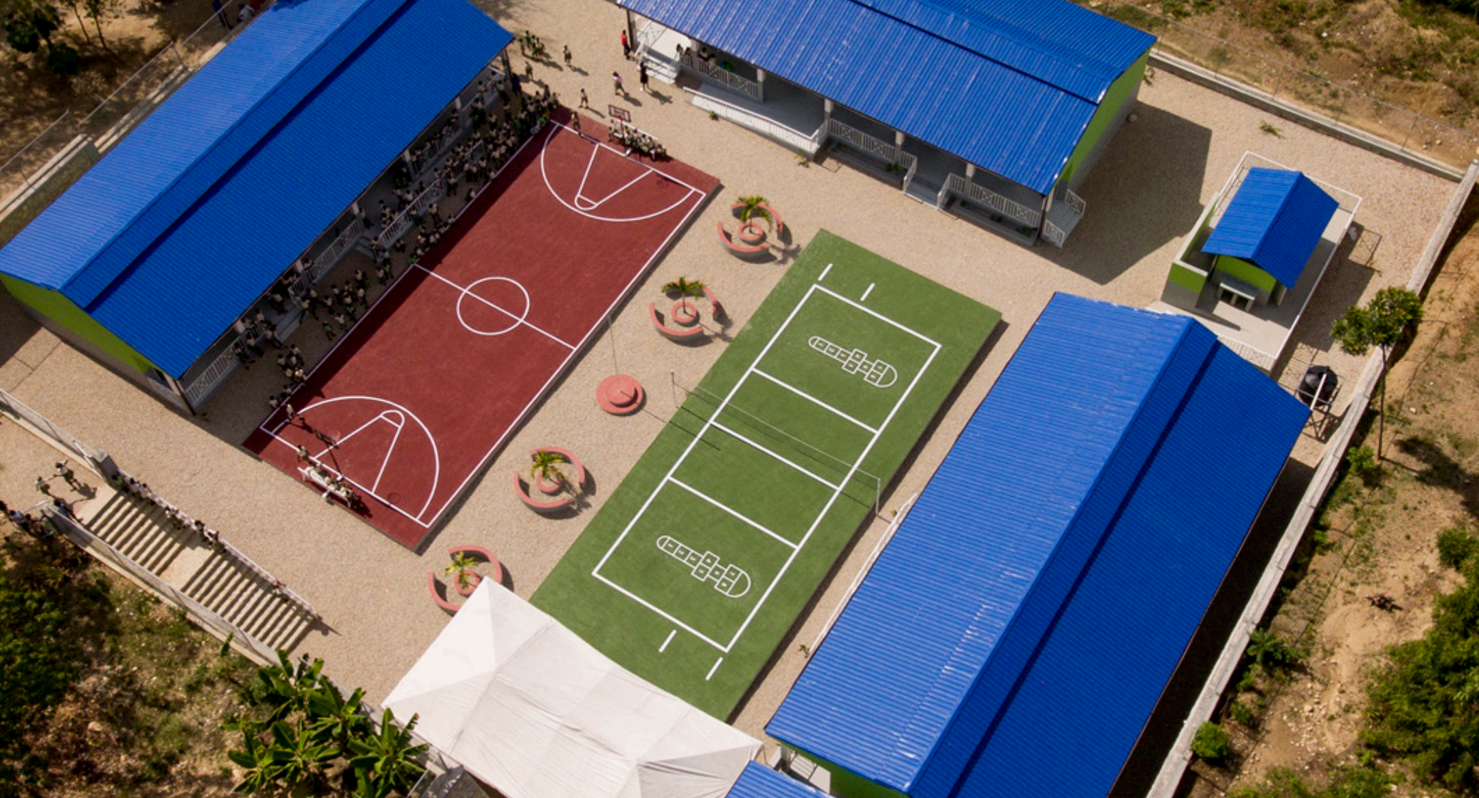
Ecole Communautaire de La Ruche