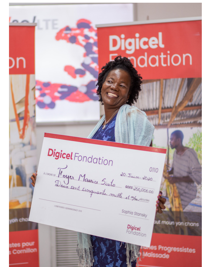
Foyer Maurice Sixto