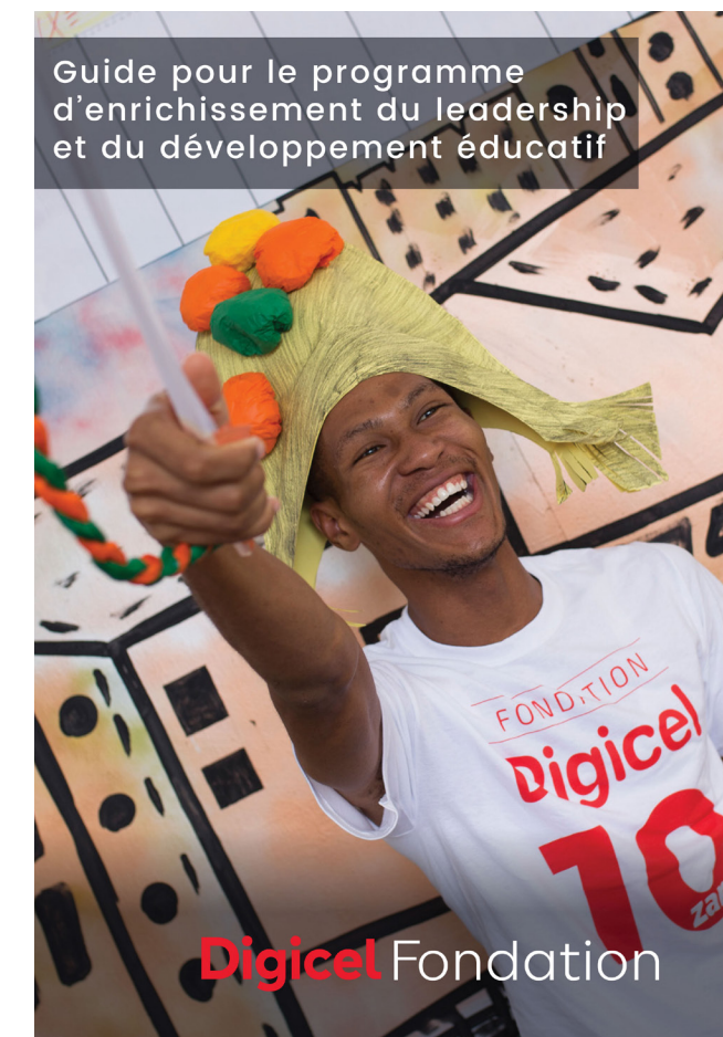
Guide de la Fondation Digicel