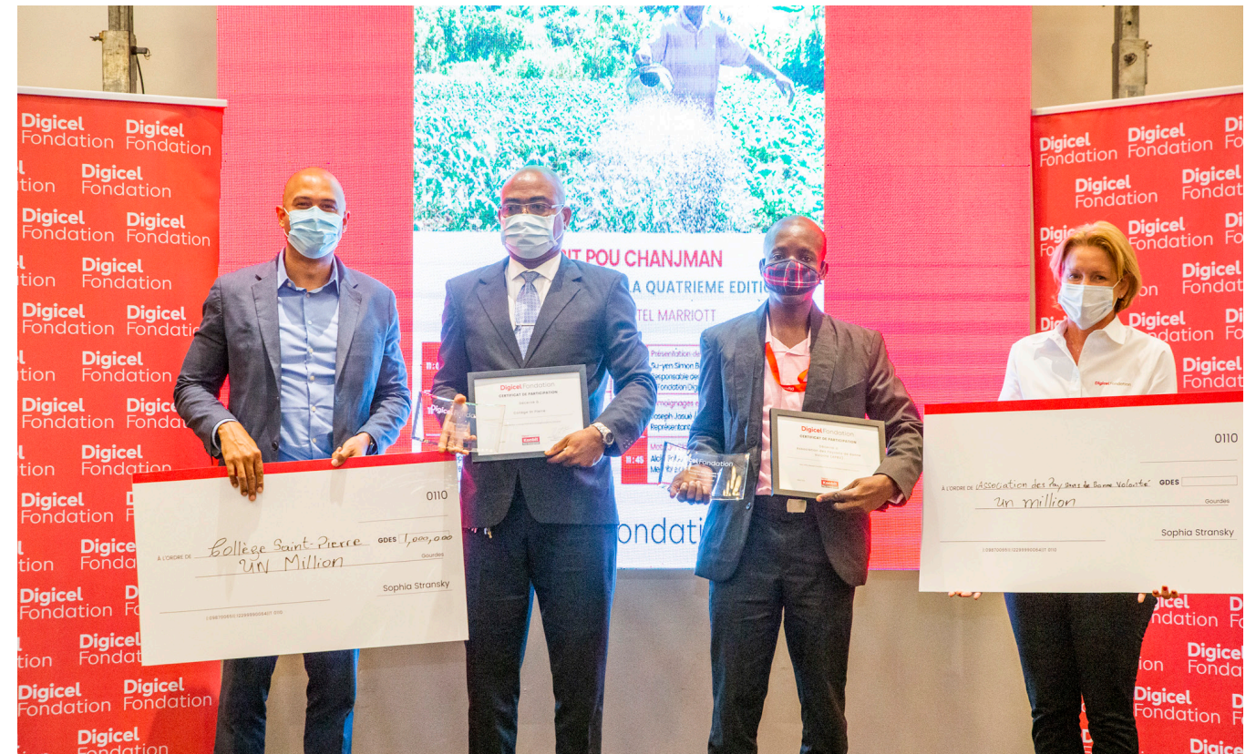
KPC IV finale de l'Ouest