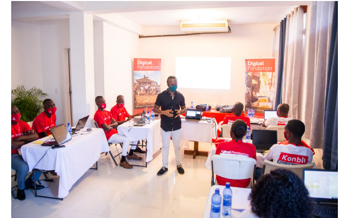
KPC IV séance de formation