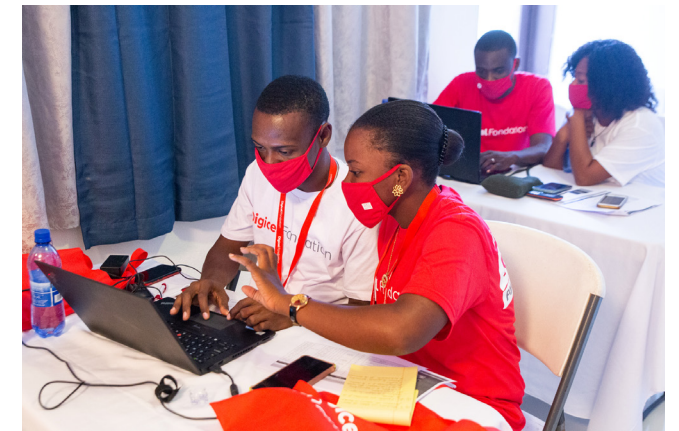
KPC IV séance de formation