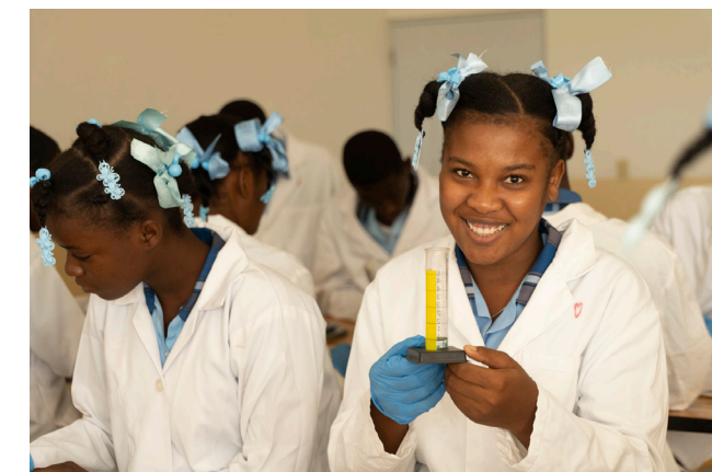
Foi et Joie