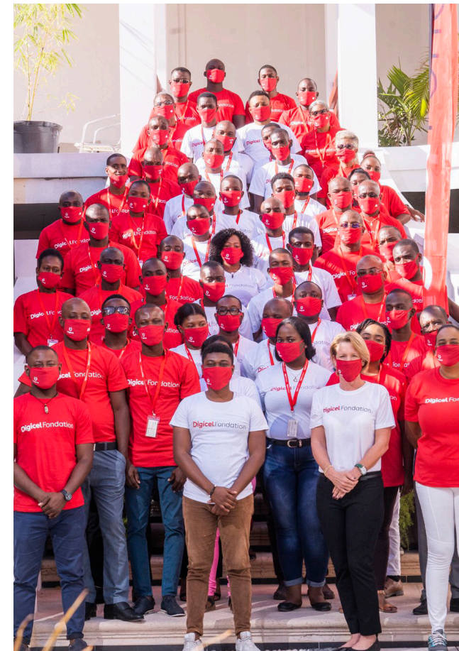
KPC IV finalistes