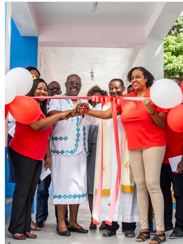
École Joly Garden