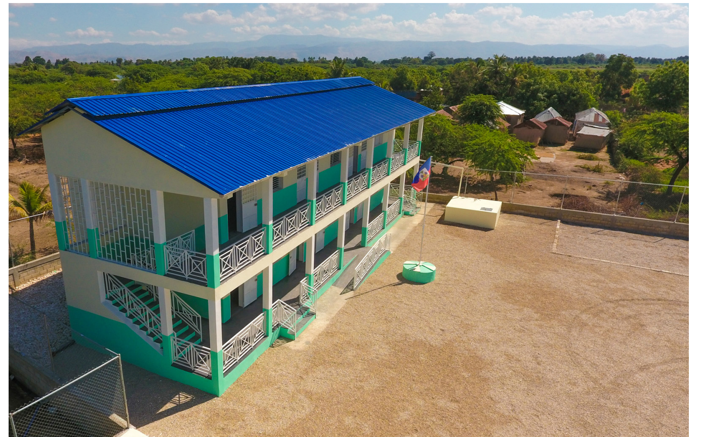
École Presbytérale de Poirier