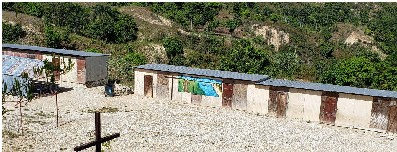
Institut Notre Dame de Pernier, photos d'avant et d'après