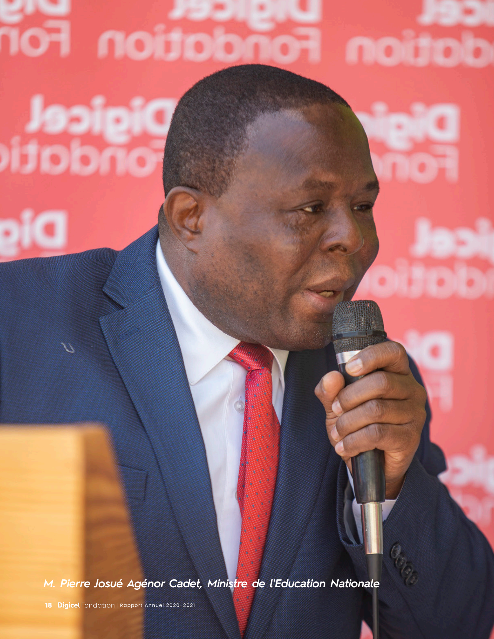
M. Pierre Josué Agénor Cadet, Ministre de l'Éducation Nationale