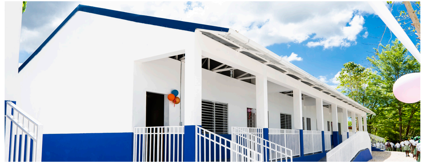
Collège Frères Unis de Ravine Sable